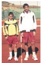
Participantes de los torneos