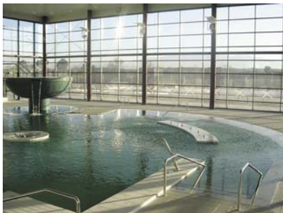
La laguna interior con el Moncayo al fondo

Las instalaciones interiores del Centro son muy completas. No se ha escatimado en nada a la hora de su construcción y acondicionamiento para que la estancia en él, sea totalmente agradable. Podemos encontrar una laguna interior de hidroterapia, donde la temperatura del agua oscilará entre 32°C y 34°C. Esta cuenta con multitud de efectos acuáticos, camas de burbujas, cuellos de cisne, cascadas, corrientes, jacuzzis, hidro-