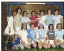
Murchante A quedó en segunda posición