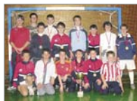
Cabanillas quedó en primera posición