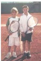
Participantes de los torneos

Se esta disputando el primer torneo de tenis tanto en adultos como en escolares. En adultos se juega por el sistema de liga en masculino y femenino, y ya se están jugando los primeros partidos. Este torneo finalizará el 23 de junio coincidiendo con el final de la escuela de tenis. Los escolares juegan por el sistema eliminatorio tanto en femenino como en masculino. La inscripción ha ascendido a 25 adultos y 20 niños.