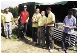
Entrega de premios

El pasado 7 de mayo se celebró en Tudela la cuarta tirada de la Liga Nacional de Tiro con arco. En ella participaron arqueros de Madrid, Cataluña, Rioja, Valencia, Aragón, Castilla la Mancha, Andalucía, Murcia, Extremadura y Navarra. En esta competición par-