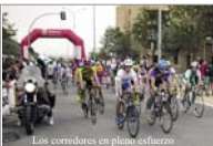
Los corredores en pleno esfuerzo