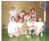
Murchante B quedó en tercera posición