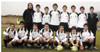
La plantilla del Cadete 1º Año del CD Tudelano Charo