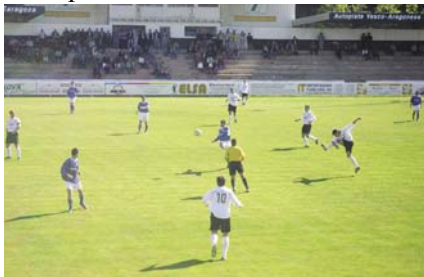
Fortísimo lanzamiento de Ascarza en partido contra el Marchante cuyo resultado fue de 2 a 0 para el Tudelano.