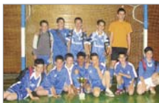
Ablitense quedó en tercera posición

La Mancomunidad Deportiva Navarra Sur organizó en Cortes el VI Torneo de Fútbol-7 Alevín Masculino y el IV Torneo de Fútbol-Sala Alevín Femenino. Estos torneos son una de las actividades dentro del programa de Deporte Escolar.