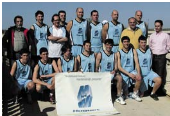
Plantilla del Huguet Arenas de 2ª División Autonómica