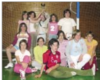
Ablitas quedó en cuarta posición