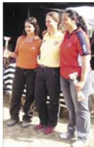
Ganadoras categoría mujer

El pasado 7 de mayo se celebró en Tudela la cuarta tirada de la Liga Nacional de Tiro con arco. En ella participaron arqueros de Madrid, Cataluña, Rioja, Valencia, Aragón, Castilla la Mancha, Andalucía, Murcia, Extremadura y Navarra. En esta competición par-