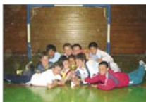
Cortes A fué el segundo clasificado