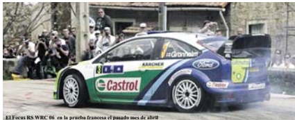
El Focus RS WRC 06 en la prueba francesa el pasado mes de abril

visiones. Con el fin de reducir los costes en los rallyes del mundial, el uso extensivo de materiales como el titanio ha sufrido severas restricciones, y los ingenieros de Ford tuvieron que encontrar un sustituto que fuera resistente sin añadir demasiado peso. La suspensión continúa usando amortiguadores Reiger, así que los representantes de esta firma holandesa se unieron a Loriaux y a su equipo de trabajo durante la fase de diseño. Además, también estuvieron presentes durante los primeros kilómetros de test para ayudar a con la configuración inicial.