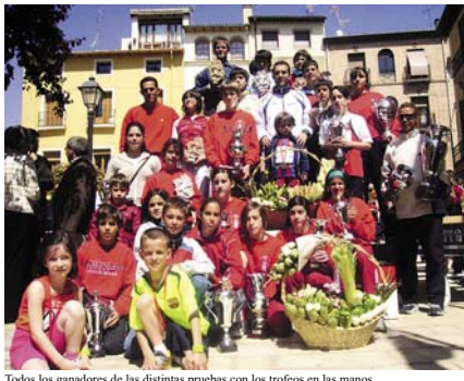
Todos los ganadores de las distintas pruebas con los trofeos en las manos.