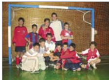
En cuarta posición Ribaforada