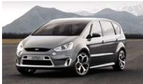
El Nuevo Ford S-MAX

Un aspecto y una dinámica más deportivos, con gran amplitud y modularidad, dan la bienvenida al nuevo Ford S-MAX. Ford ha bautizado oficialmente la versión de producción del SAV Concept. Su nombre, Ford S-MAX, deja claro que conjuga el estilo deportivo (la S proviene de Sport) y el placer de conducción, con la flexibilidad y el máximo espacio para los ocupantes.