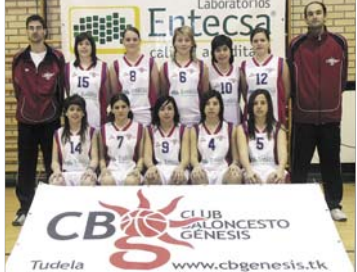
Plantilla del Junior Femenino Entecsa-Génesis

ción de actividades como el minitrap, juegos de mesa y partidas de cartas.