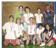
Cascante B fueron las primeras clasificadas