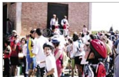
Concejal de deportes

El domingo 15 de mayo se celebró el día de la bicicleta. En esta jornada deportiva participaron más de 600 personas, saliendo desde Tarazona 200 aproximadamente y el resto de nuestra ciudad.